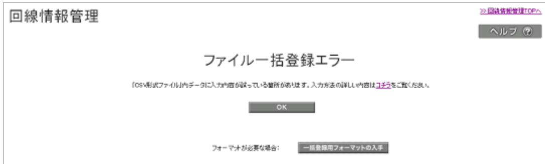
「ファイル一括登録エラー」画面

アップロードファイルのCSV形式に誤りがある場合「ファイル一括登録エラー」画面が表示されます。ファイル形式を修正し再度アップロードをしてください。